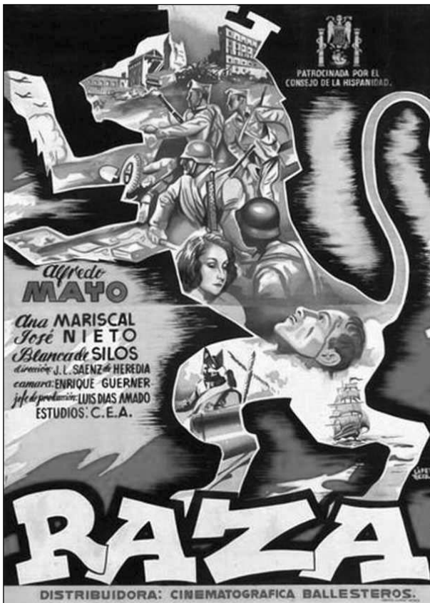
Raza (1942) de José Luis Sáenz de Heredia