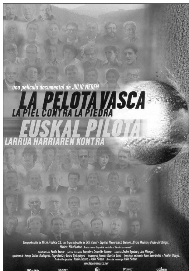
La pelota vasca. La piel contra la piedra (2003) de Julio Medem